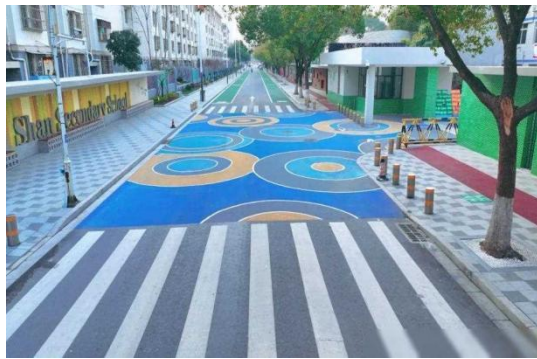
聚氨酯陶瓷防滑颗粒层